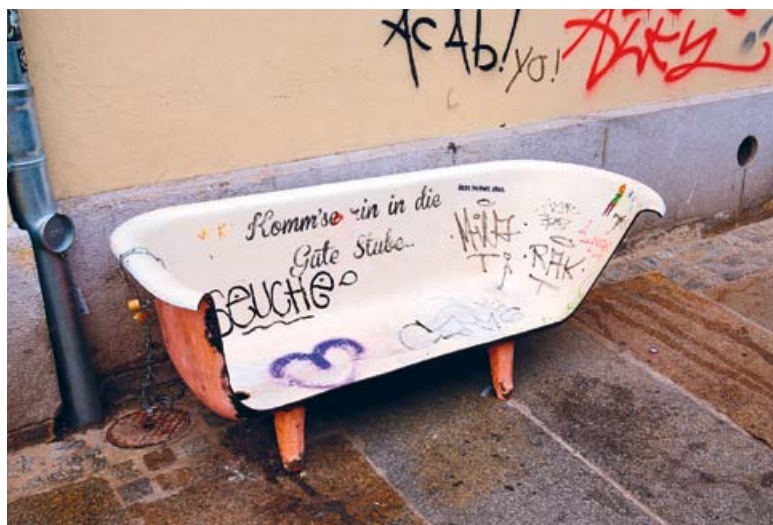
Скамейка в Neustadt (А. Аббасов)