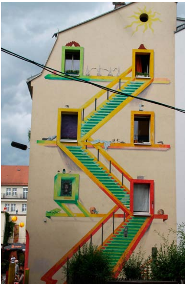
Вот такая "лестница" (В. Рубинфельд)