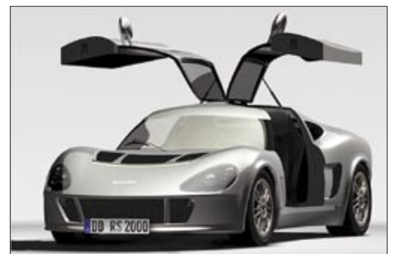
На фото: слева - легендарный Melkus RS 1000, внизу - макет нового RS 2000

КАРУСЕЛЬ - единственный в Дрездене русский магазин, работающий до 22 часов!!!